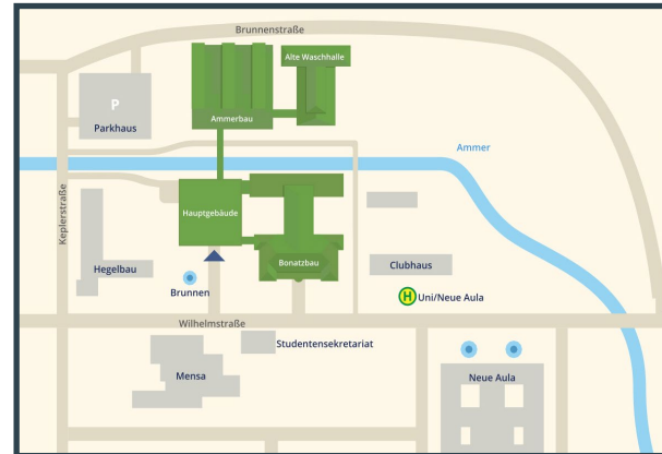
Campus Wilhelmstr. 32