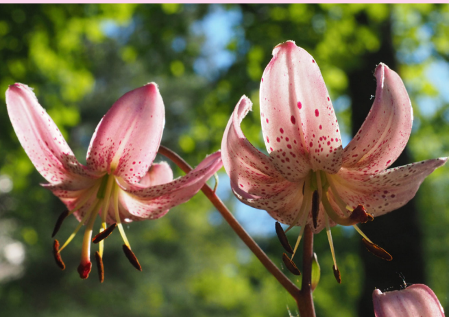
Es gibt sehr unterschiedliche Farbausprägungen der Blüte.

In Natur werden die Blütenknospen oft von Rehen abgefressen. Ein weiterer Schädling ist das Lilienhähnchen, ein knallroter Blattkäfer, dessen Larven große Löcher in die Blätter fressen. Die Larven tarnen sich mit dem eigenen Kot um für Vögel möglichst unappetitlich zu sein – was natürlich schlecht für die Lilien ist.