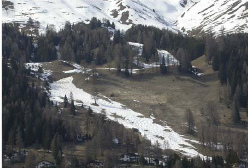
Abb. 4: Verzögerte Ausaperung auf einer Kunstschneepiste im schweizerischen Davos. Kunstschnee kann 2-3 Wochen später ausapern als Flächen mit Naturschnee.

Eisklumpen oder Kugeln. Eine feine Kristallbildung ist nicht möglich, da der Kristallisationskern fehlt. Kristallisationskerne können in der Atmosphäre vorkommende Fremdpartikel wie Silberjodid sein, an die sich die unterkühlten Wassertropfen anlagern können. Bei der Beschneigung wird dagegen mit Hilfe von Druckluft Wasser durch eine Düse gepresst und sinkt nach dem Prinzip der Abkühlung