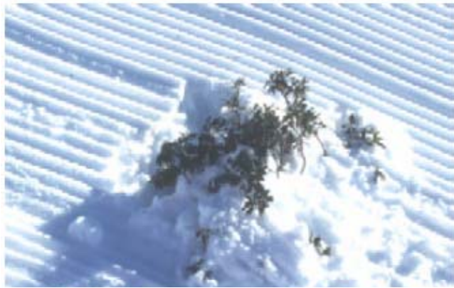
Abb. 3: Alpenrose auf frisch präparierter Skipiste.

Durch die Bearbeitung mit schwerem Gerät ist eine häufige Vereisung der Schneedecke zu beobachten, was wiederum zu Sauerstoffmangel für die darunter wachsenden Pflanzen führen kann (Abb. 2). Dies geschieht in Folge der Anreicherung von CO 2 durch die Atmungsaktivität der eingeschlossenen Pflanzen und Bodenlebewesen. Das CO 2 kann Werte zwischen 40-44 % erreichen, während die