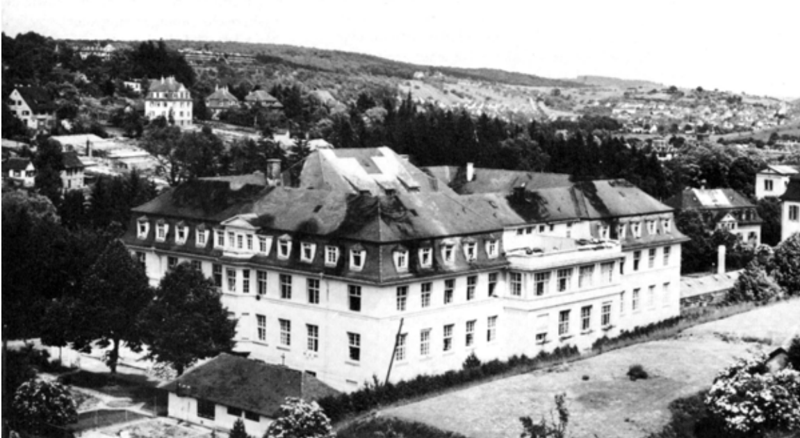
Die Hautklinik mit dem roten Kreuz auf dem Dach