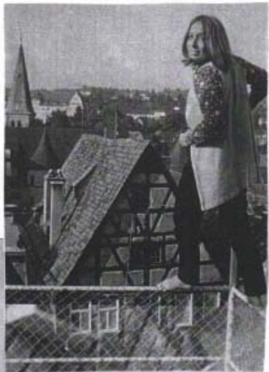
Terrassenblick auf Altstadt