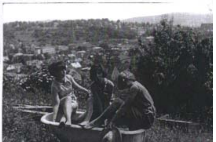
Sonntagmorgen um Tübingen herum