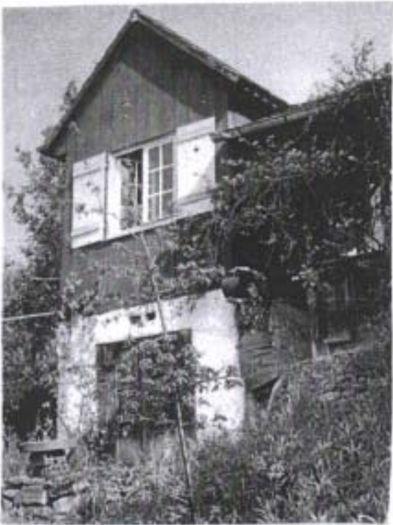
Sommer im Gogen-Häuschen