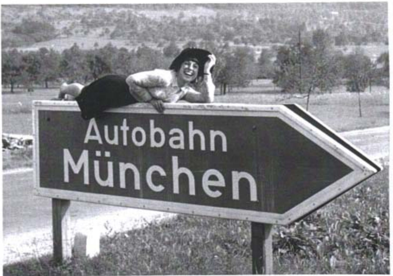
Tramp-Abschied nach Bayern