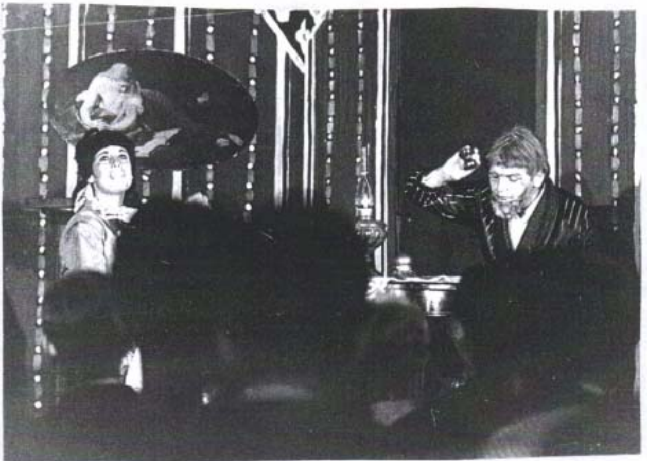
Labiche: Gibier de potence