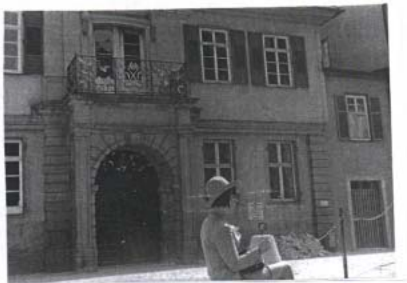
Heimat Alte Aula, Romanisches Seminar