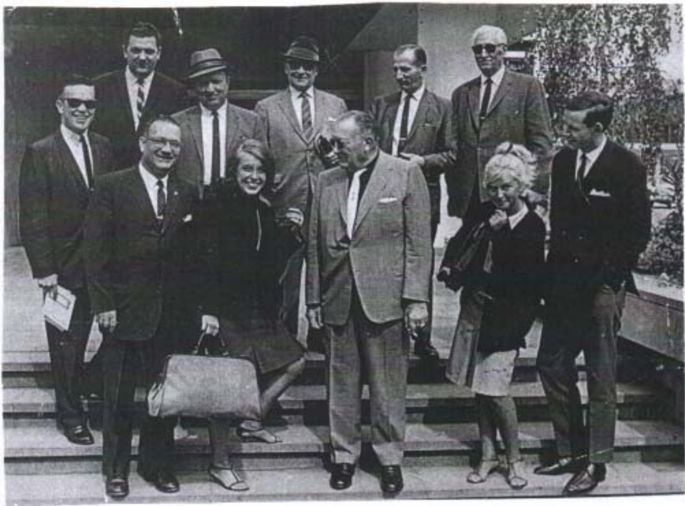
Stuttgart, Schloßgarten Mit den Chefs von General Motors