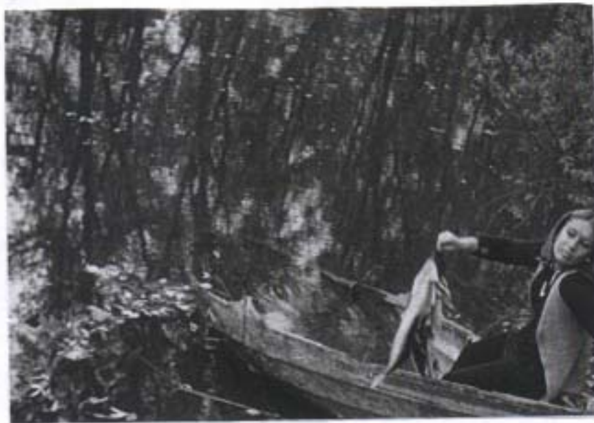
Neckar, Mäuerle und sinkendes Schiff