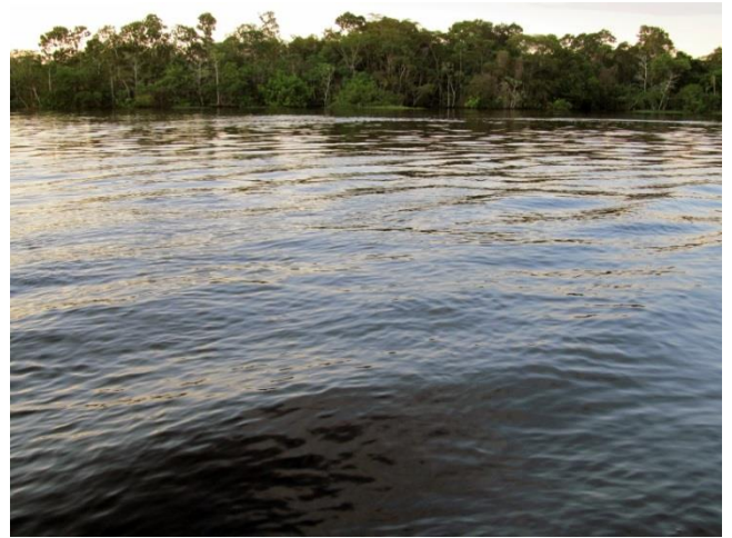
Amazonasgebiet Brasiliens: Gefluteter Auenregenwald am unregulierten Fluss Paraná do Mamori.