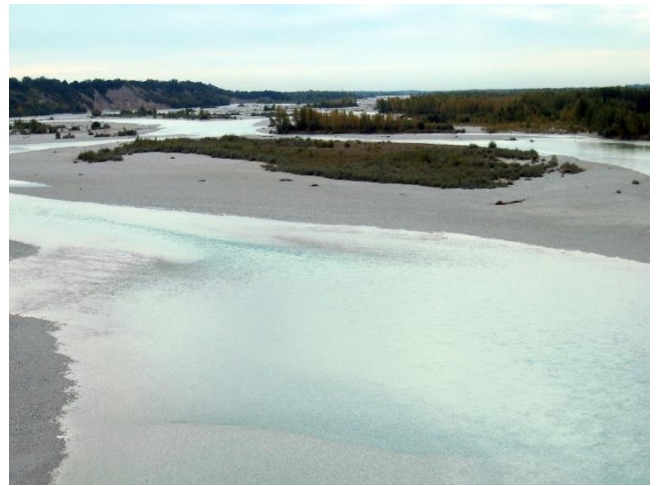
Der Tagliamento in Friaul, Oberitalien, ist einer der letzten Wildflüsse Europas.