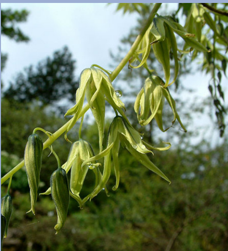
Gelbliche Blüten des Blaugurkenstrauchs.

Die großen, aber dennoch eher unauffälligen eingeschlechtlichen Blüten des Blaugurkenstrauchs erscheinen im Frühjahr. In einer weiblichen Blüten stehen drei getrennte Fruchtblätter, aus denen sich im Laufe des Sommers jeweils eine fleischige Balgfrucht entwickelt. Eine Blüte ergibt somit drei Früchte! Die zahlreichen schwarzen Samen im Inneren sind in eine durchsichtige, etwas schleimige Pulpe eingebettet, die süßlich und leicht nach Wassermelone schmeckt und in China frisch gegessen wird. Die Früchte bleiben auch noch nach dem Laubfall lange am Strauch und machen ihn dadurch auch zu einer attraktiven Gartenpflanze.