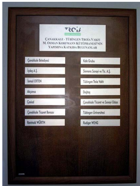
Die Ehrentafel der Stifter im Vestibül des Stiftungshauses