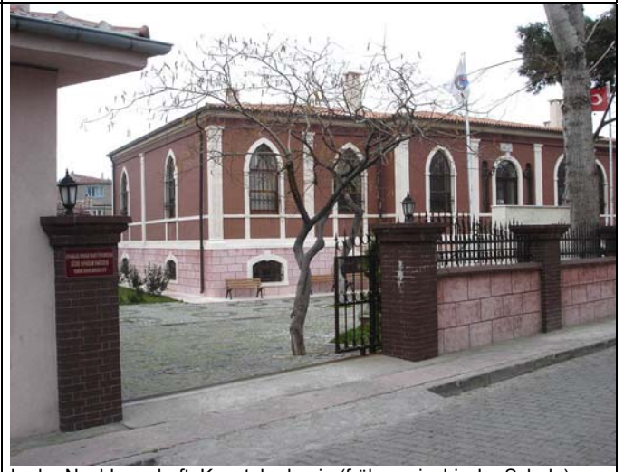
In der Nachbarschaft: Kunstakademie (früher griechische Schule)