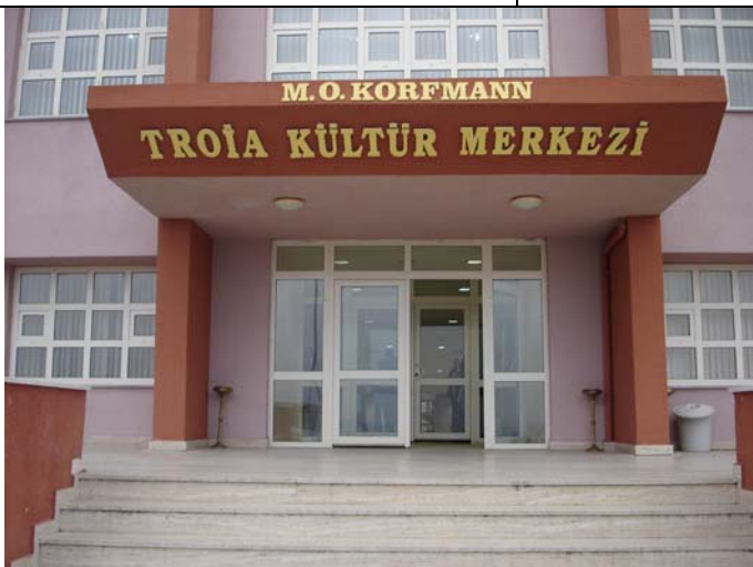
Das M.O.Korfmann - Troia Kulturzentrum auf dem Campus der Universität Çanakkale