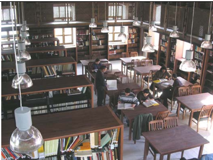
Blick in den Bibliothekssaal im 1.Stock mit Buchregalen und Arbeitstischen.