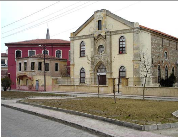
Ehemalige armenische Kirche aus dem Ende des 17. Jh. und Pfarrhaus (jetzt Universitätsgelände). Links im Hintergrund das Stiftungshaus.