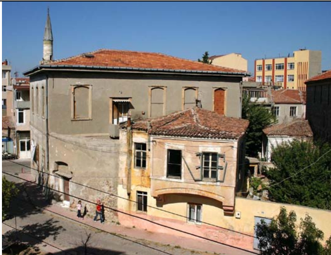
Das zweistöckige Stiftungsgebäude vor Renovierung (Sommer 2006)