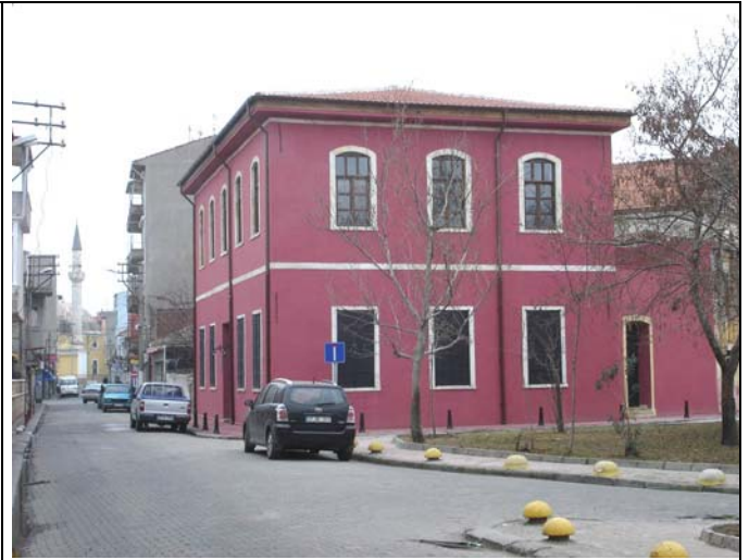
Das Stiftungshaus bei Einweihung (Febr. 2007)