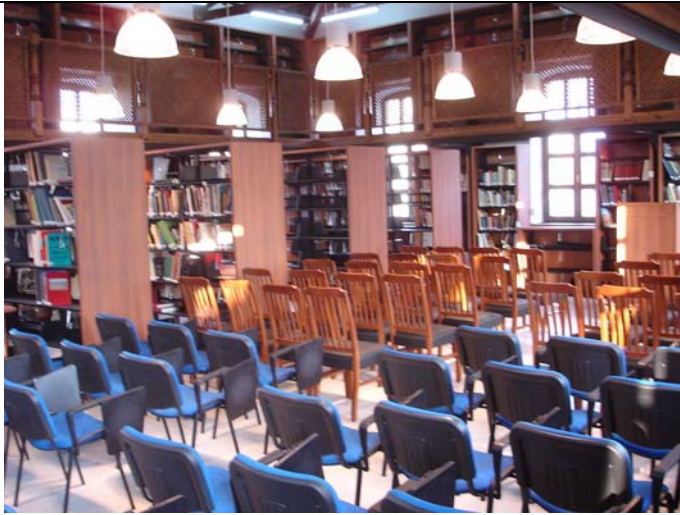
Bibliothekssaal, zur Eröffnung bestuhlt