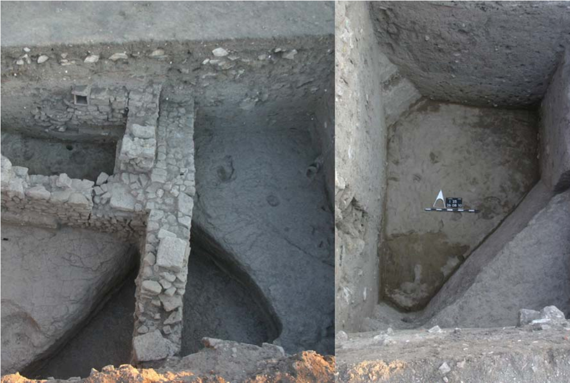
2. Die beiden Enden des spätbronzezeitlichen Verteidigungsgrabens beim Durchlass durch das 2009 und 2010 ausgegrabene Südosttor.