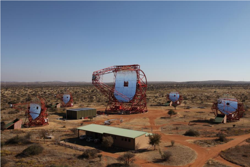
Neues Gamma-Auge für die H.E.S.S.-Familie: Das Teleskop besitzt einen Antennendurchmesser von 28 Metern und wiegt fast 600 Tonnen.